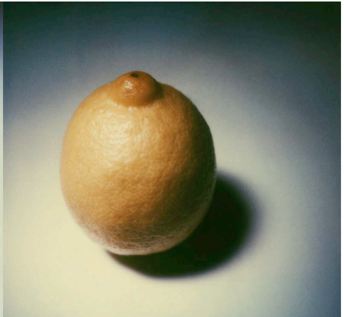
Vitamine gibt es in Hülle und Fülle - in einheimischem Obst ebenso wie in importierten Südfrüchten. Aber besonders ältere Menschen nehmen ...